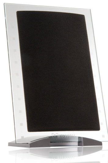
Hurricane sur socle en option